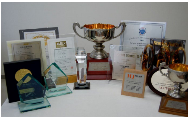
受賞した賞状・トロフィー類

アキュフェーズ製品はこのような設計理念から生まれ、国内はもとより海外のオーディオ・ファイルからも高い評価と絶大な信頼をいただき、創立翌年の 3 機種 (C-200/P-300/T-100) から始まり、 約 50 年間の発売機種数は、実に 250 機種余り (年平均 5 機種発売) になります。