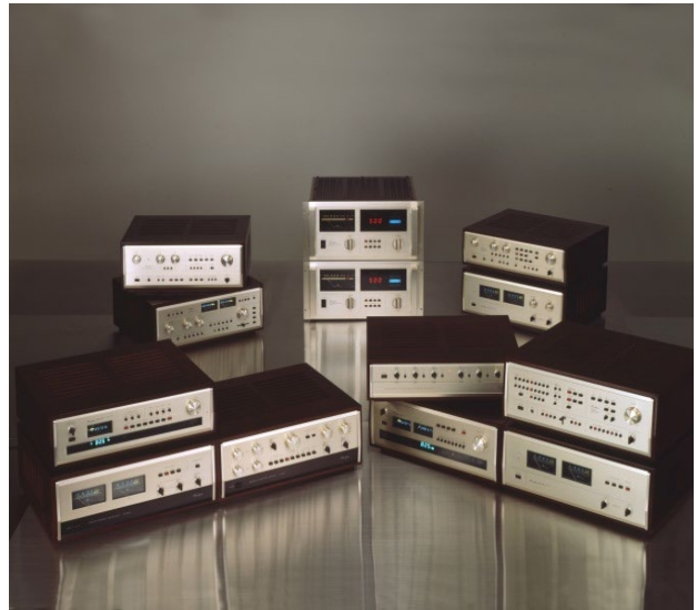
創業から 1990 年位までの初期製品群

アキュフェーズ製品はこのような設計理念から生まれ、国内はもとより海外のオーディオ・ファイルからも高い評価と絶大な信頼をいただき、創立翌年の 3 機種 (C-200/P-300/T-100) から始まり、 約 50 年間の発売機種数は、実に 250 機種余り (年平均 5 機種発売) になります。