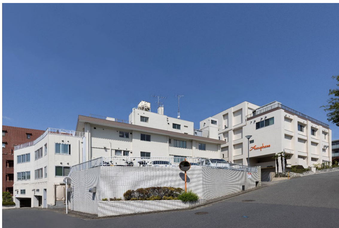
横浜市青葉区の本社全景

1973年：『日本コンポグラフィ』に於いてP-300金賞受賞 にもかかわらず、その年の秋、『日本コンポグラフィ』（ラジオ技術社主催）に於いて、P-300が『金賞受賞』など、その音の良さと完成度の高さと市場の圧倒的支持を得ることに成功、アキュフェーズ飛躍の原動力となり、同時に日本に於けるハイエンド・オーディオの幕開けとなりました。