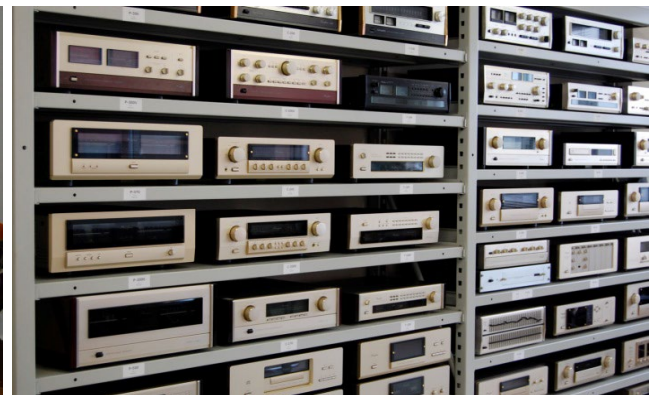
今まで製造した製品を保管