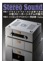
ステレオサウンド