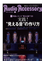
オーディオアクセサリ